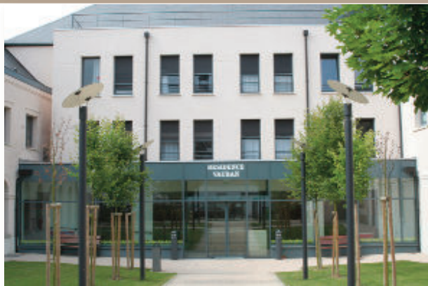
Résidence VAUBAN 25 rue Jean Jaurès 59530 Le Quesnoy