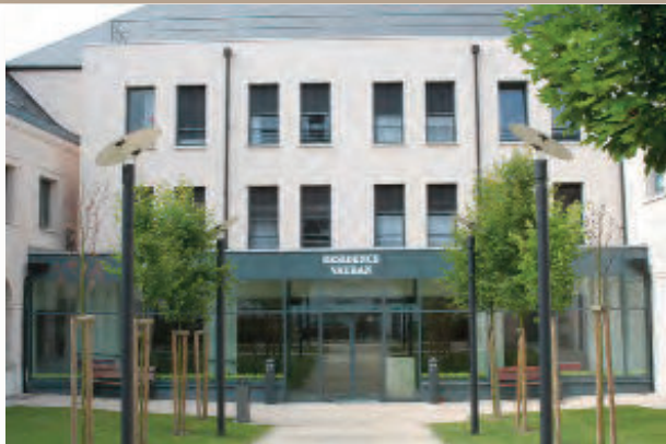
Résidence VAUBAN 25 rue Jean Jaurès 59530 Le Quesnoy