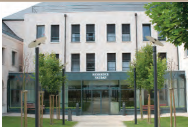
Résidence VAUBAN 25 rue Jean Jaurès 59530 Le Quesnoy