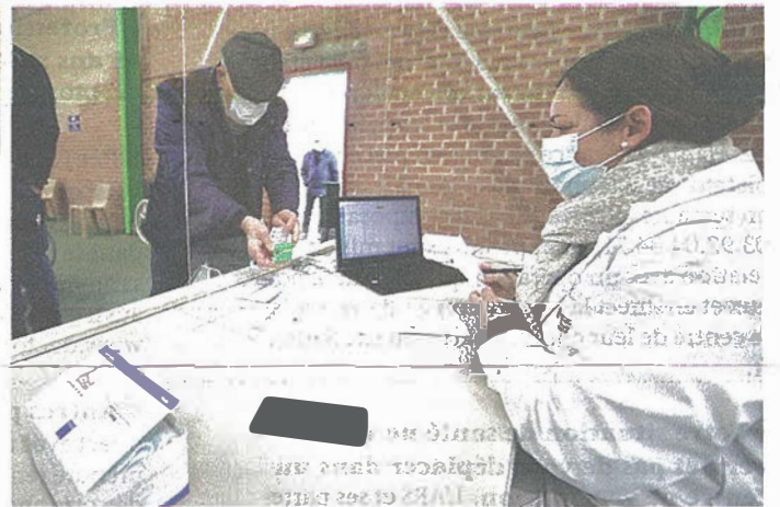
Se faire vacciner, c'est aussi des formalités administratives, comme on le voit ici à l'entrée du centre de vaccination.