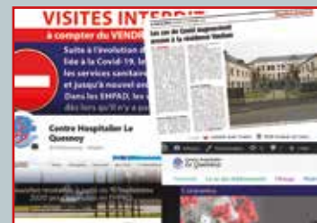
Gouvernance et crise sanitaire