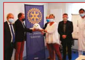
L'UCC se familiarise avec la nouvelle recrue