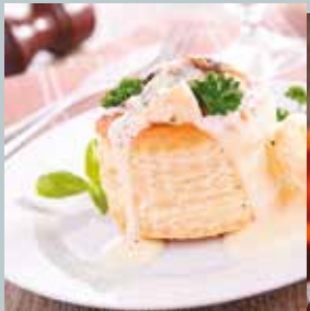
Bouchées à la Reine